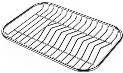
Tellerständer aus Edelstahl 8100 154